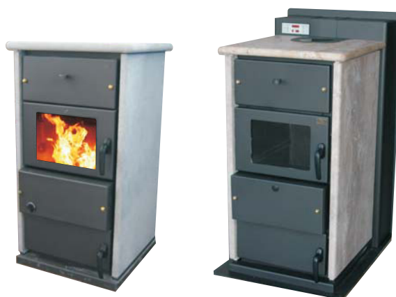
N - INC Legna