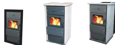
NT domestic Legna + trito